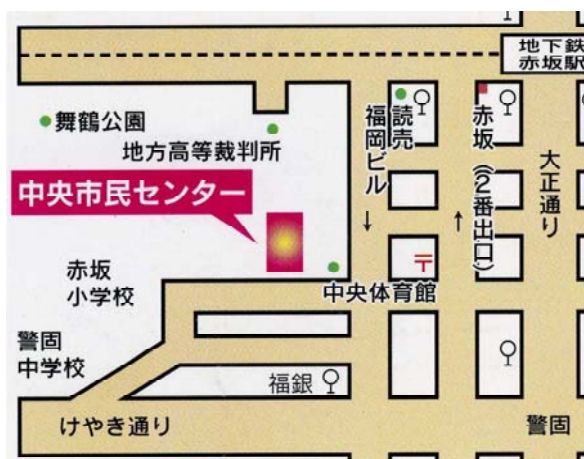
「シニアフレンズ福岡」事務局の所在地 (中央市民センター内)

○ シニア世代の皆さん！「シニアフレンズ福岡」に参加して、自分にふさわしいボランティア活動を始めませんか。皆さんからのご連絡を待っています！ (R)