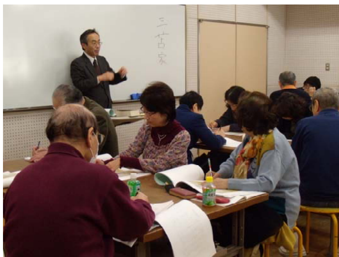
平成21年1月27日の受講風景 (福岡市立中央市民センター・実習室)

本講座の受講者が、地元古文書の広範な活用のため、翻刻ボランティアとして活躍されることが大いに期待される。